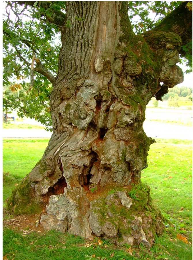
Rommer så mangt-eik: med knallgul svovelkjuke (t.v.): Vemmannsås naturreservat i Larvik. Til høyre: ved Tomb kirke, Råde, Østfold.

En utvalgt naturtype er særskilt sikret etter naturmangfoldloven. Det er derfor ekstra viktig at vi vet hvordan vi best kan passe på dette spesielle levestedet. Vi vet at mange av de grove, gamle eiketrærne vokste fram i et åpent jordbrukslandskap, og trives best når de får fortsette å stå fritt og soleksponert. Og det er bare noen tusentalls slike store eiker, med hulrom og mye vedmuld, igjen i kulturlandskapet vårt. Vi vet også at mange av artene tilknyttet eika liker sol og varme, og det er vist at åpenhet rundt gamle hule eiker gjør at flere av de utrydningstruede insektartene trives.