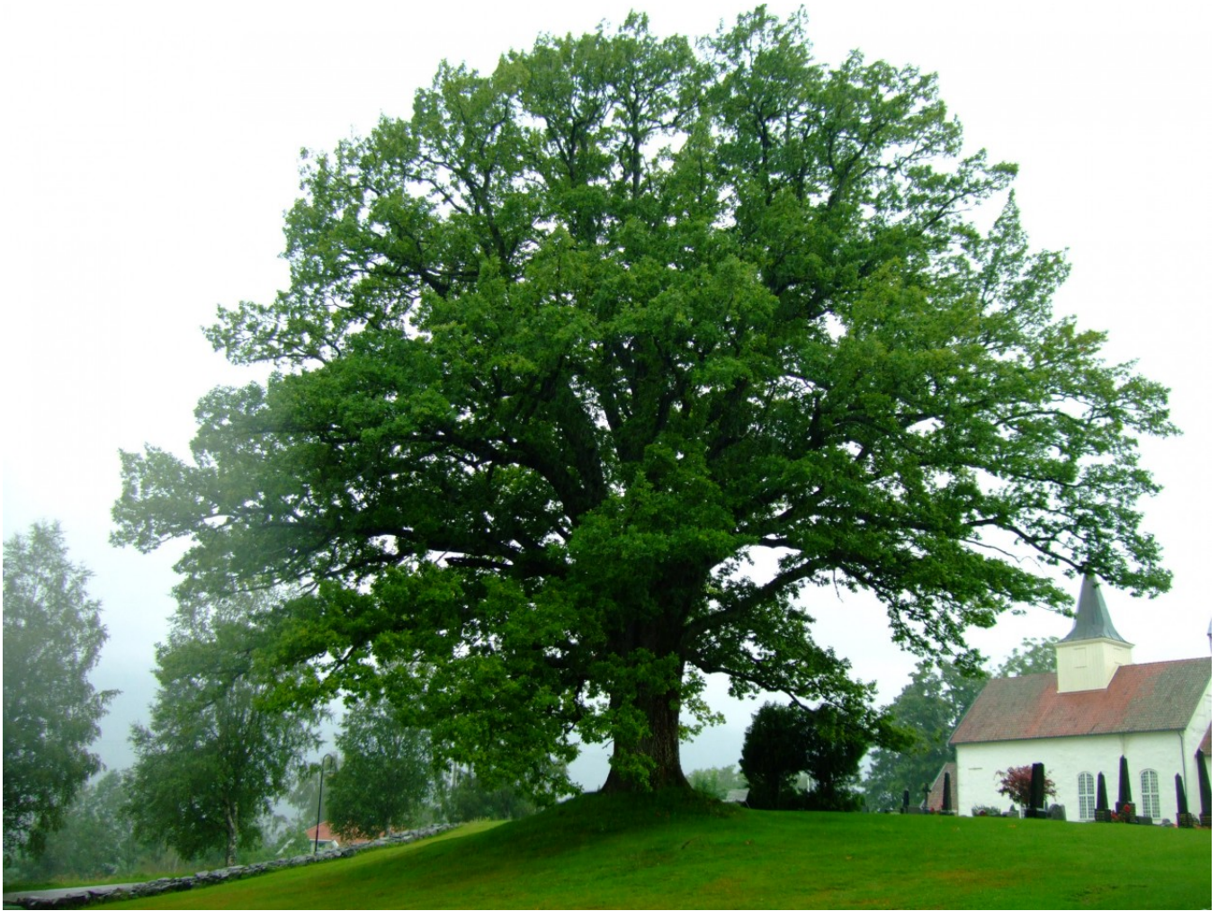
Sakral eik. Hof kirke, Hof i Vestfold.