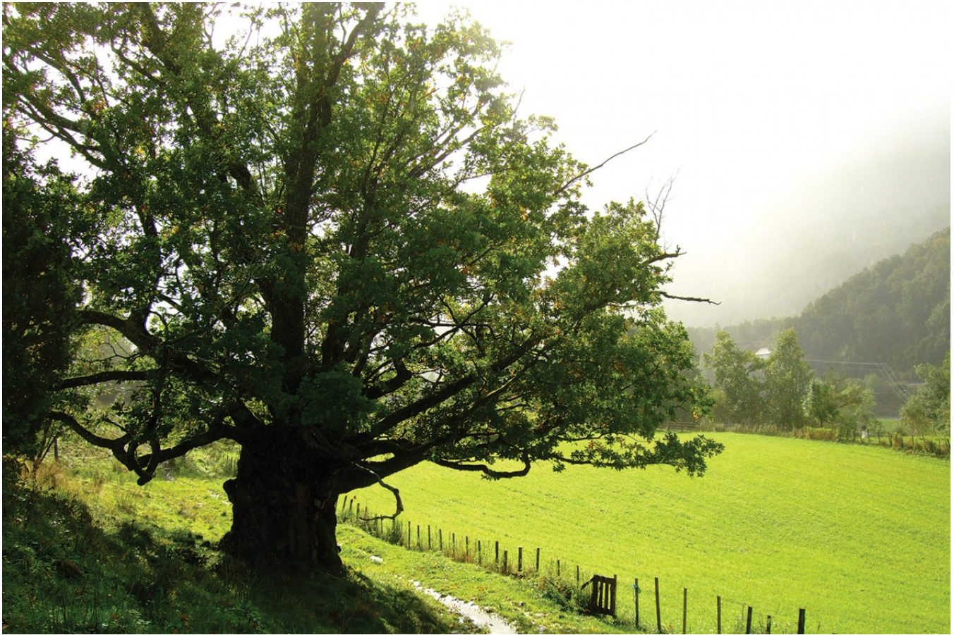
Superfin eik. Berge landskapsvernområde, Kvam kommune, Hordaland.