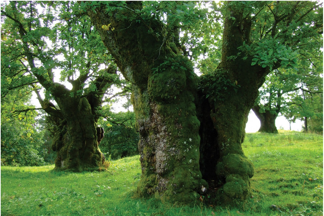
Harry Potter-aktig eik (Prylepilen som smadrer bilen til Ronny & Harry). Berge landskapsvernområde, Kvam, Hordaland.

Det er skumt, men ikke helt mørkt. Det lukter sopp og våt mold, som en svak anelse av høst. Samtidig et søtlig hint av varmt treverk, som et løfte om en kommende vår. Slik ville innsiden av en hul eik fortonet seg, om du kunne kripe inn der.