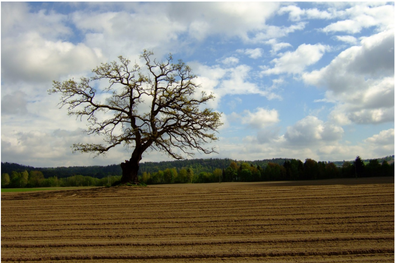
Fin eik. Larvik kommune, Vestfold.