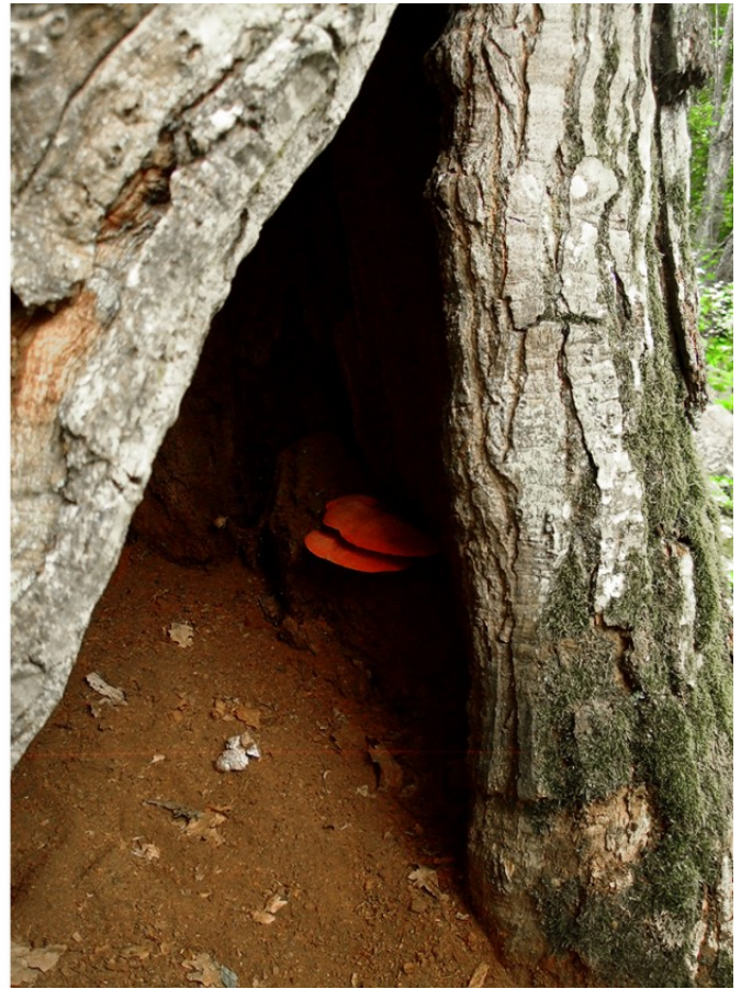
Herlige små hulrom i flott eik, og man kan skimte en oksetungesopp der inne: begge Bjärka Säby, utenfor Linköping, Sverige.